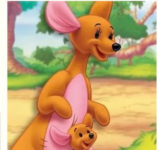
Кенга и Крошка Ру