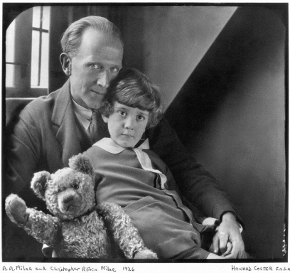
А.А.Милн с А. Кристофером Робин Милн, 1926.

Алан Александр Милн (18 января 1882-31 января 1956), английский детский писатель и поэт.